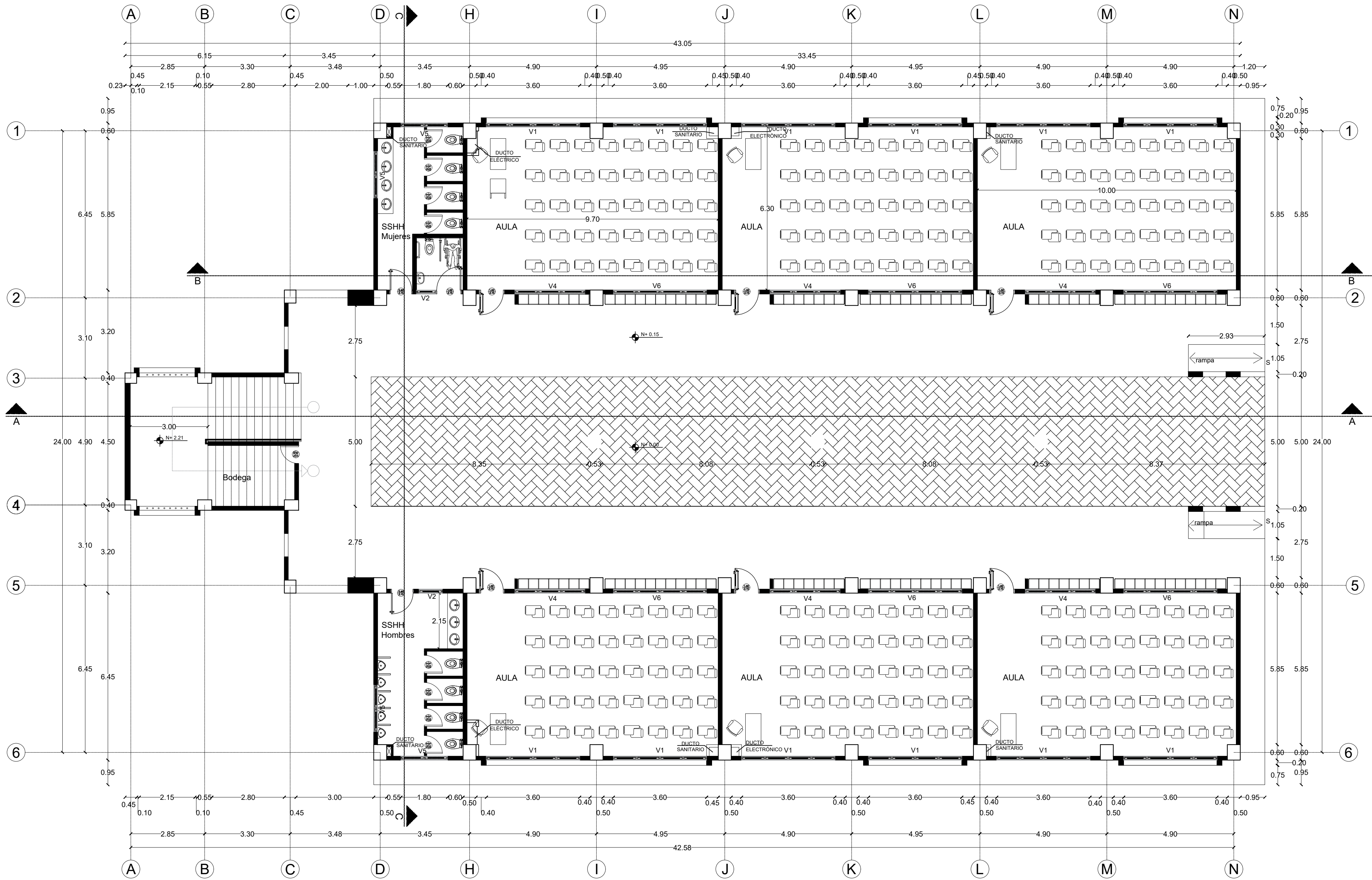
BLOQUE 1A - PLANTA BAJA ESCALA 1:100